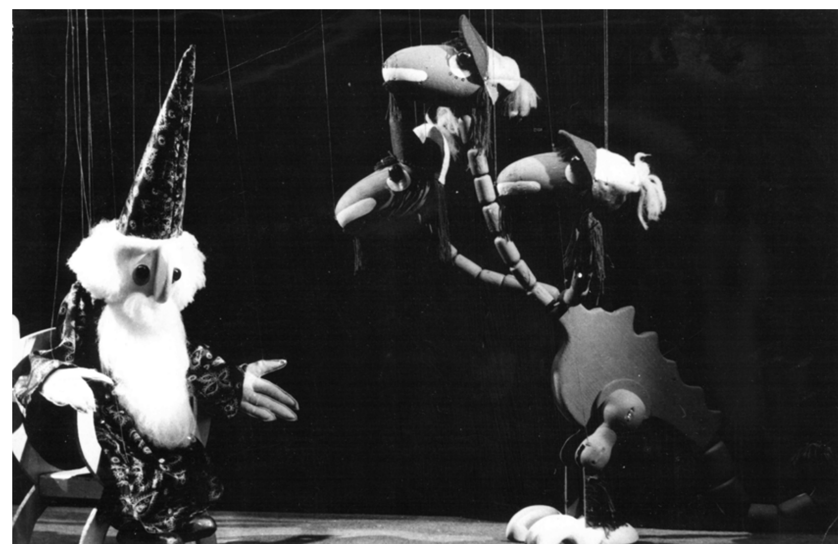
Pohádky na draka, prezentované na Loutkářské Chrudimi v roce 1982.