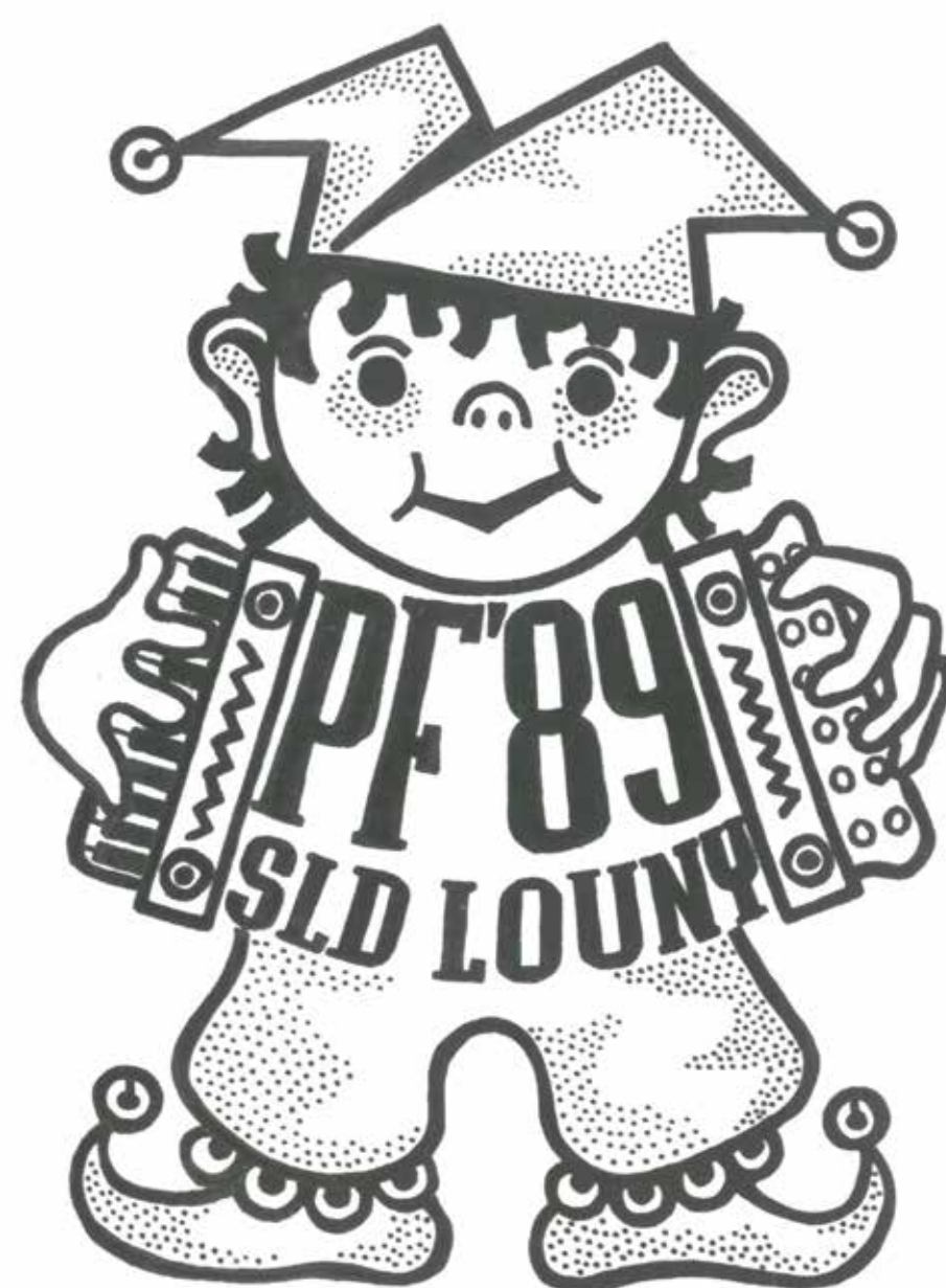
Novoroční přání loutkářů z roku 1989.