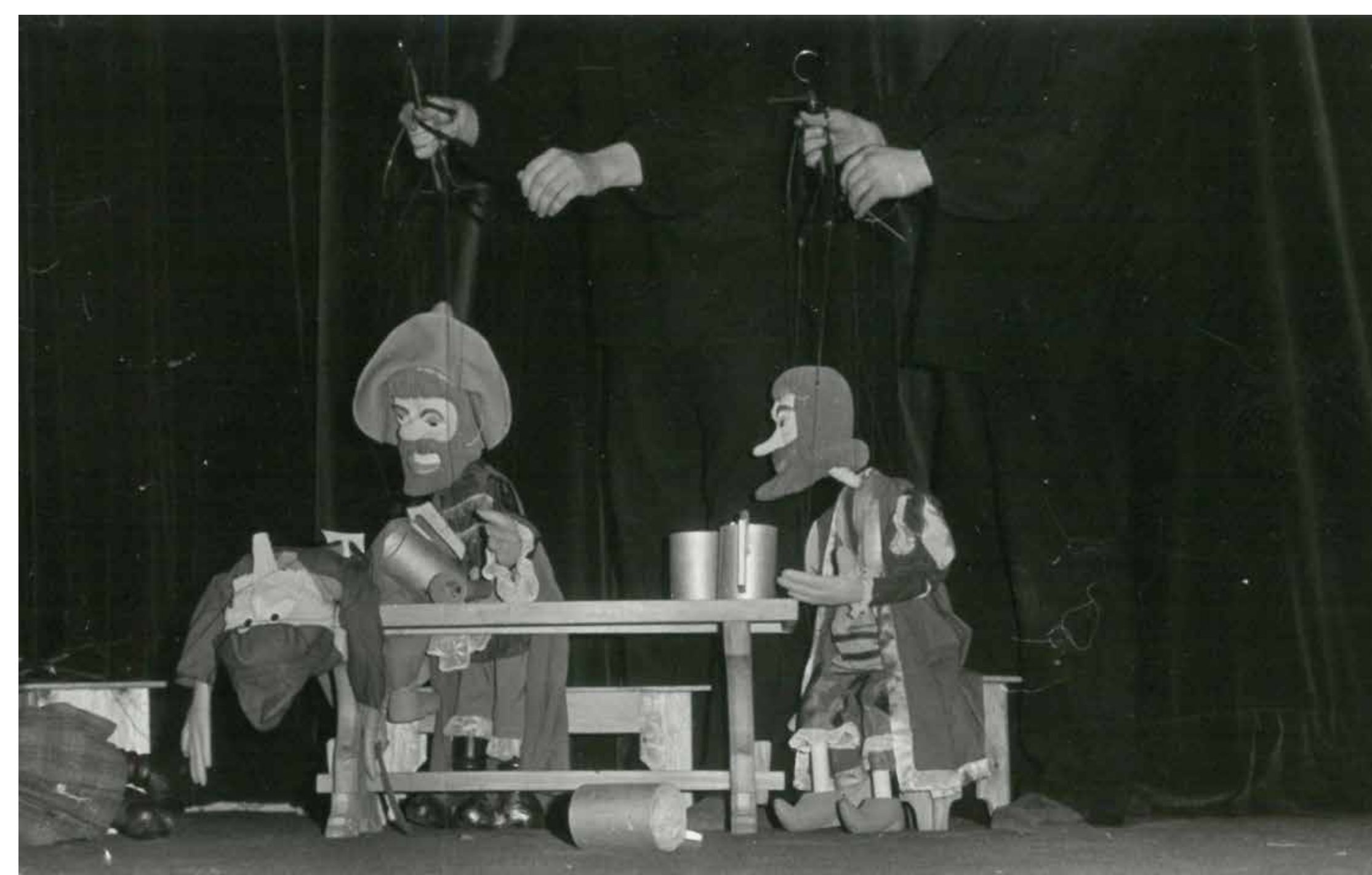
V roce 1985 se lounští loutkáři prezentovali na prestižní přehlídce Loutkářská Chrudim s představením Poslechněte, jak bývávalo.