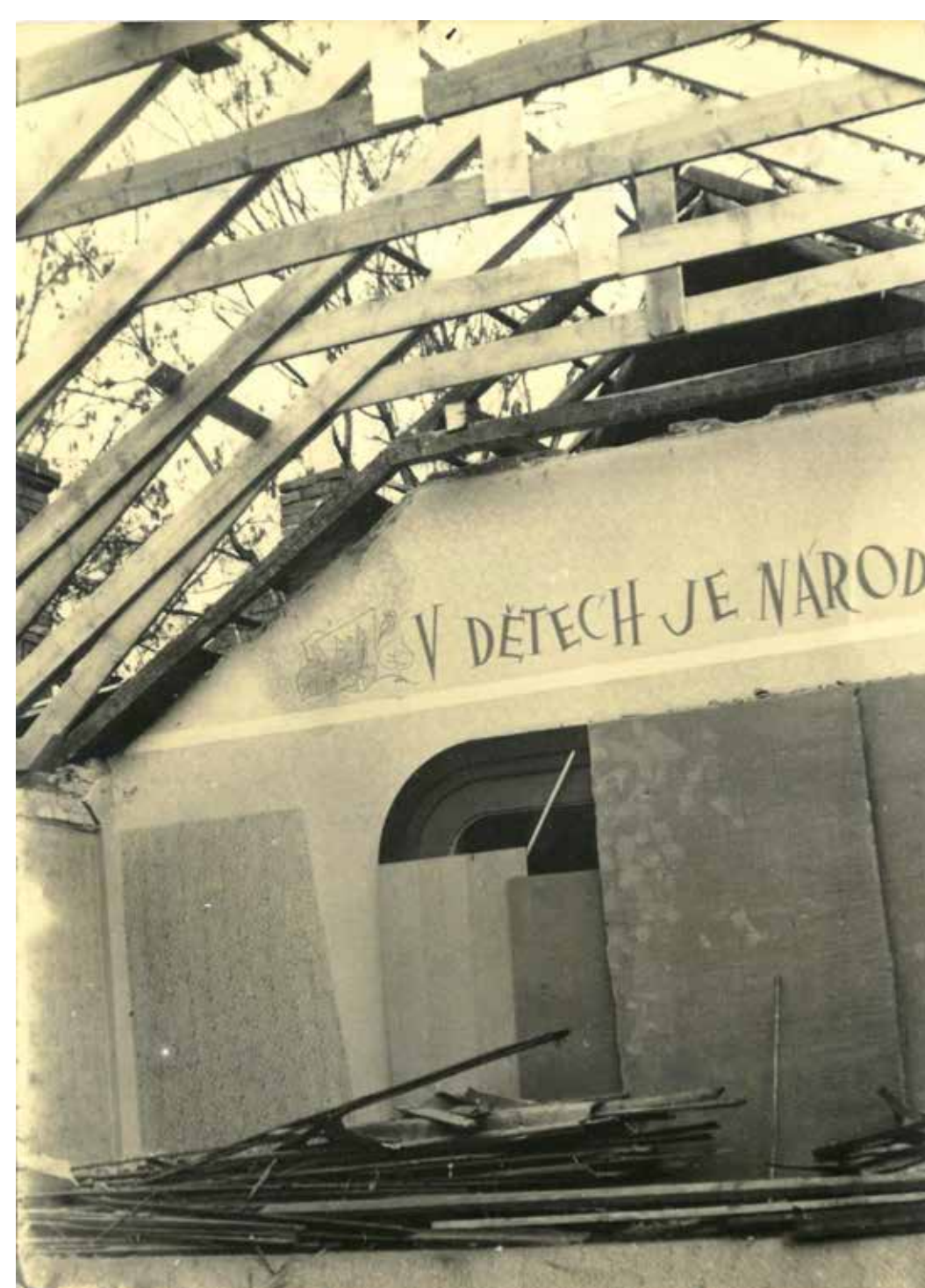
V roce 1958 prošlo divadlo rozsáhlou přestavbou.