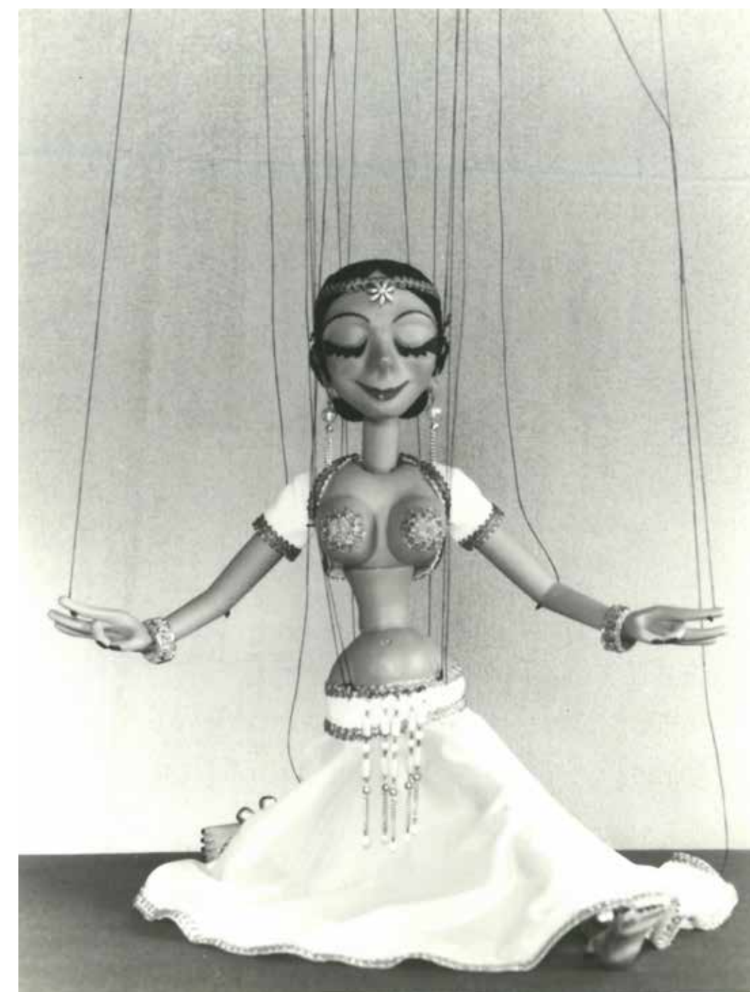
U příležitosti vzácné návštěvy indické delegace byla sehrána pohádka Zářící princezna.