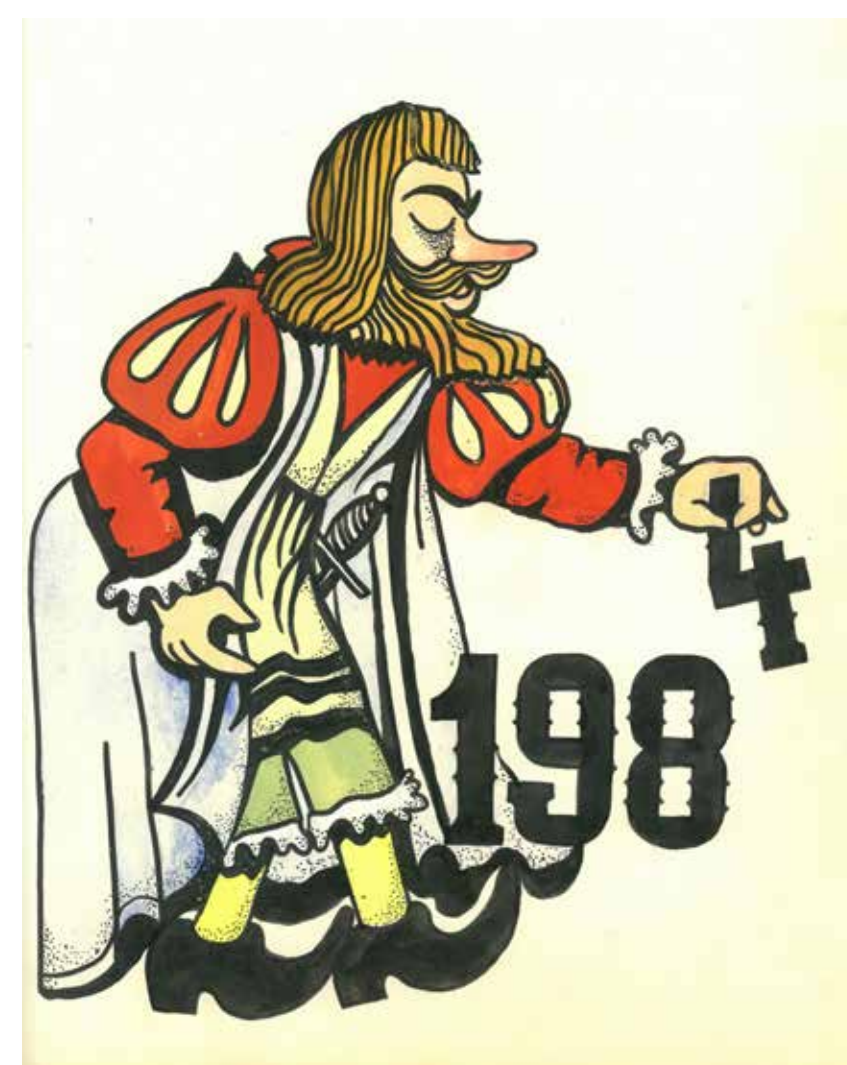
Dochovala se velmi pěkně zdobená spolková kronika. Takto začínal rok 1984.