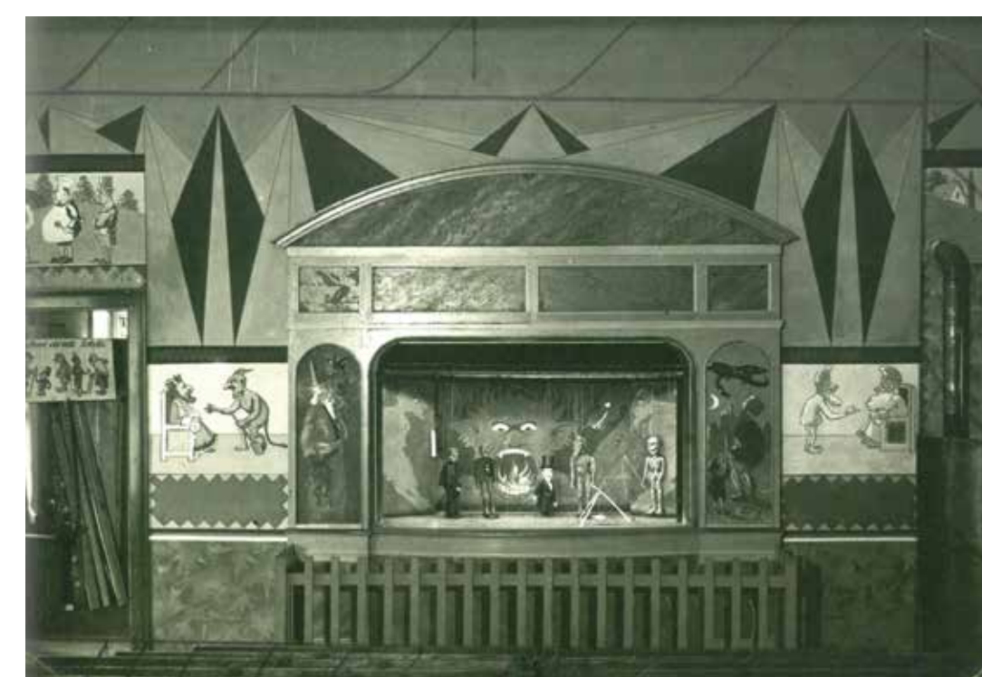
Pohádka Začarováný les z doby kolem roku 1930.