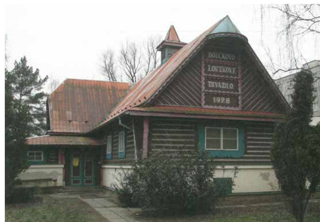
Boučkovo loutkové divadlo v Jaroměři bylo otevřeno u příležitosti 10. výročí vzniku Československa v roce 1928. Vzniklo úpravou staršího, již nevyužívaného stavení.