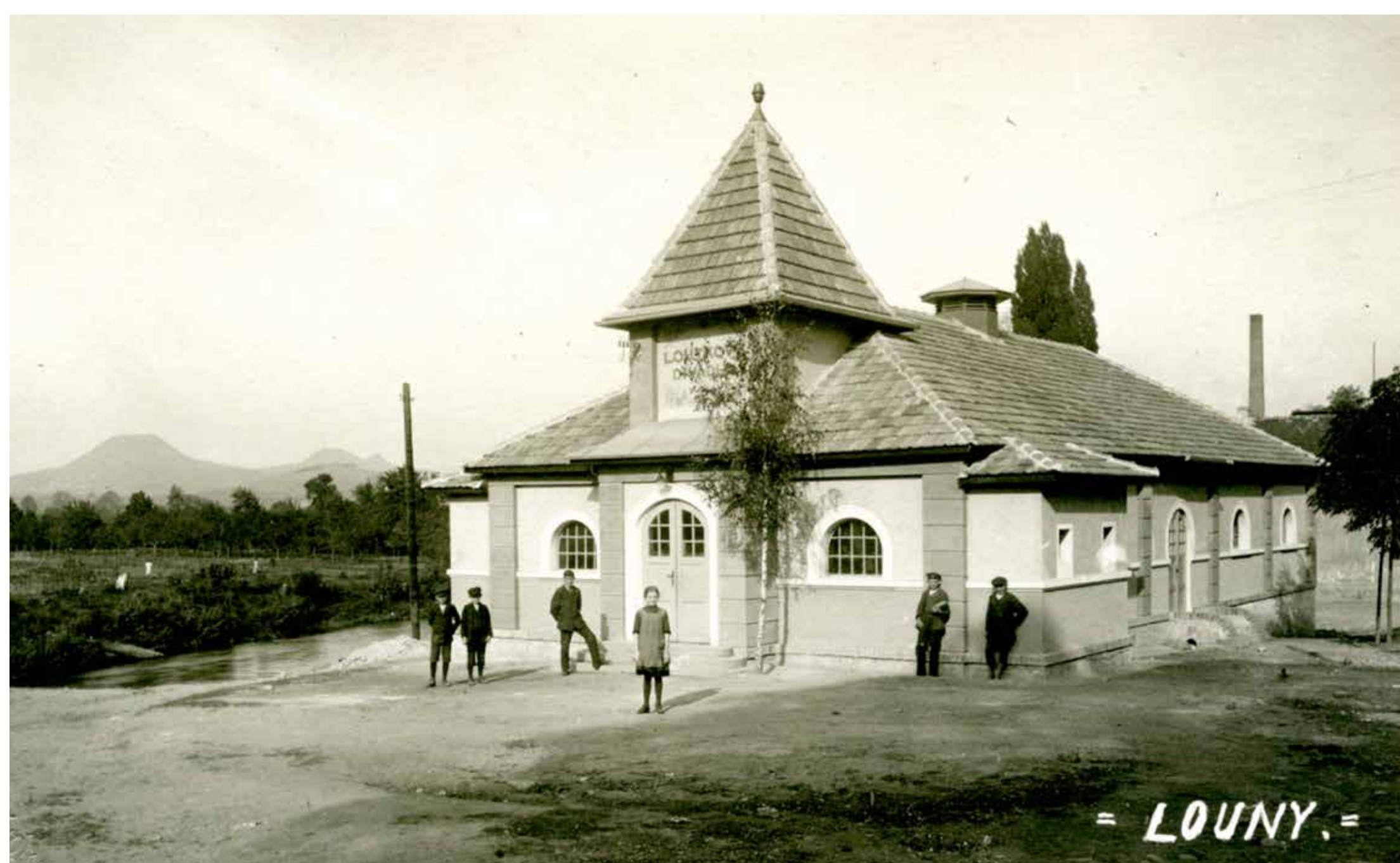
Nejstarší loutkové divadlo v Československu bylo otevřeno v roce 1920 v Lounech.

Krátce před 1. světovou válkou se v loutkářství začaly objevovat první snahy o vybudování vlastní budovy loutkového divadla. Tato myšlenka vycházela z nepříjemné praxe, kdy loutkáři hráli střídavě v hostincích a sokolovnách. Časté stěhování jevišť, kulís a loutek si vyžadovalo nejen spoustu času navíc, ale především vedlo k rychlejšímu opotřebením materiálu. Kvůli světové válce se první realizace objevily teprve po vzniku Československa. Vybudovat vlastní loutkové divadlo byl velmi složitý a finančně nesmírně těžký úkol, proto se těchto budov v meziválečném období vystavělo jen několik.