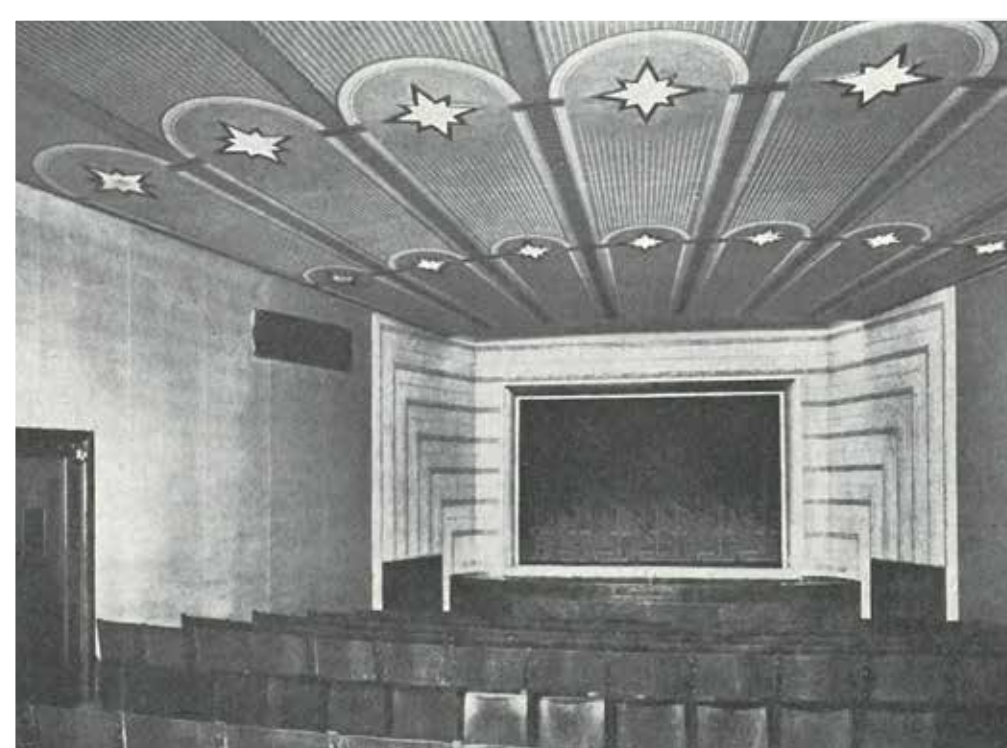
Scéna pražského loutkového divadla Říše loutek, otevřeného v roce 1928 v Městské knihovně v Praze na dnešním Mariánském náměstí.

Třetí a zároveň poslední loutkové divadlo s vlastní budovou v meziválečném Československu vzniklo v Jaroměři. Místní loutkáři nejprve vytvořili svůj odbor v rámci Sokola a v roce 1921 se osamostatnili. V roce 1924 získal soubor samostatnou budovu tehdy již nepoužívaného zahradního domku. Po jeho rekonstrukci podle plánů Otto Kubečka vznikla malebná roubená budova s prvky české lidové architektury. Divadlo s kapacitou 200 návštěvníků bylo otevřeno 28. října 1928 u příležitosti 10. výročí vzniku Československa.