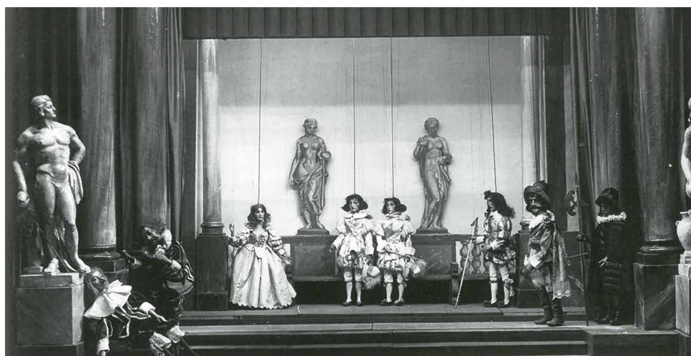
Nejvýznamnější inscenací v Říši loutek byl v období první republiky Shakespearův Večer tříkrálový.